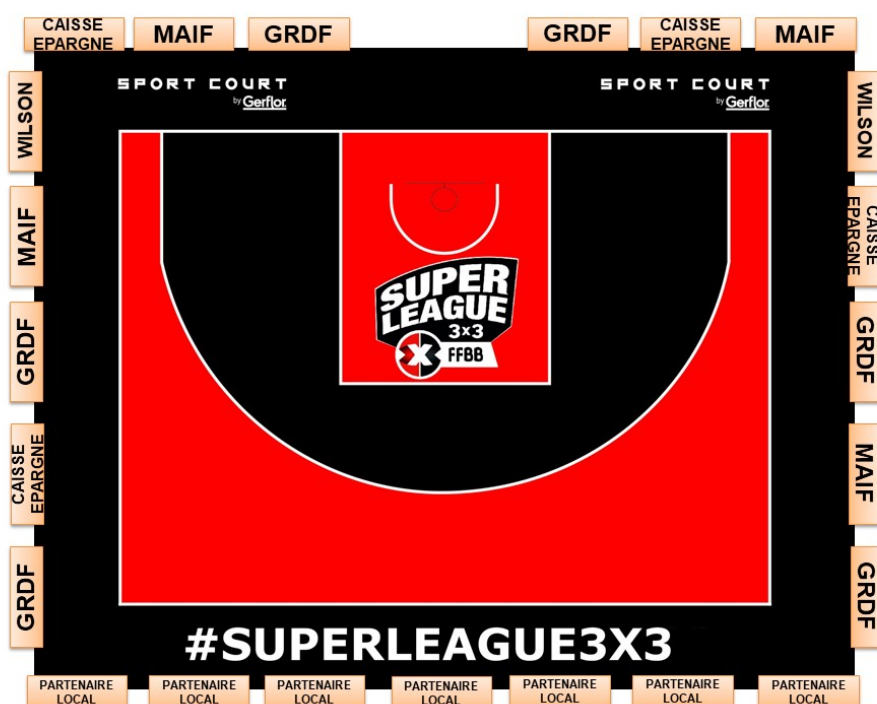
Schéma d'implantation de la panneautique du terrain principal

La panneautique autour du terrain central ainsi que les éléments d'habillage du site (exemple : flammes), y compris ceux des partenaires fédéraux du 3x3, seront fournis, acheminés au plus tard la veille de l'évènement et installés par la FFBB suivant le schéma ci-dessous. La surface de jeu ne portera aucune inscription ou publicité autres que celles définies par la FFBB.